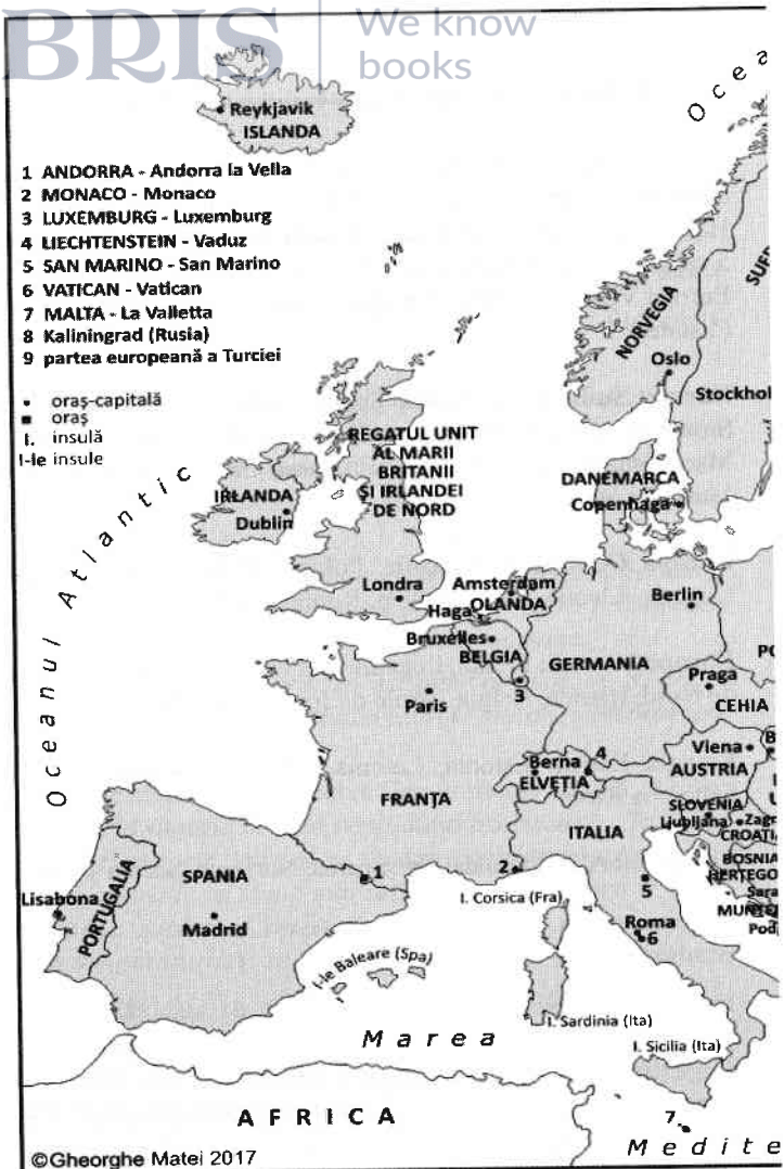
Harta 1a: Statele și orașele-capitală din Europa