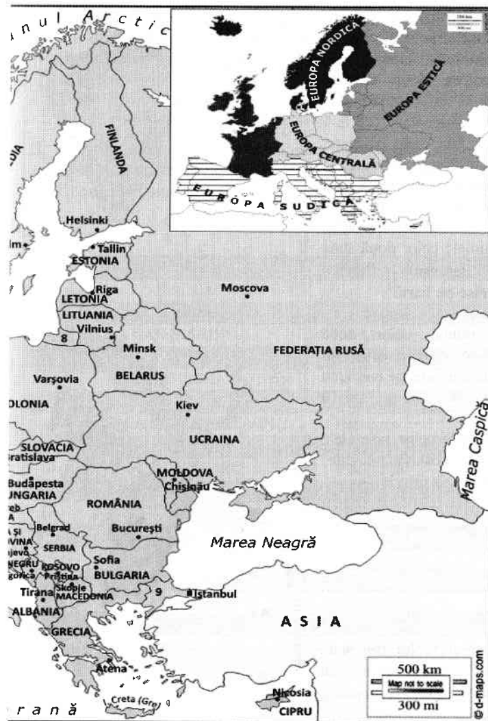
Harta 1b: Statele și orașele-capitală din Europa